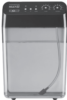
MONSOON MULTI II Programmable Misting System