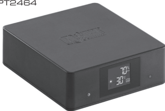
Thermostat (600W) & Hygrostat (100W) PT2464